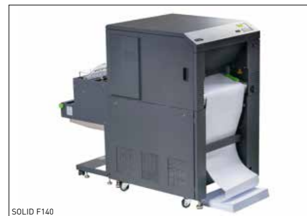
Microplex-Produkte für den Ersatz in IPDS-Druckumgebungen.